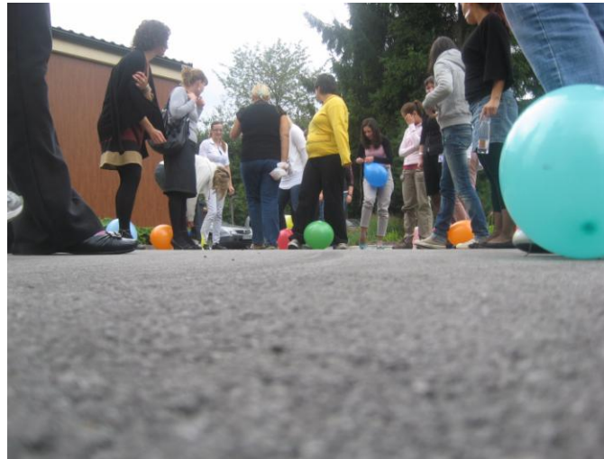
Udeleženci so se med delom zabavali na najrazličnejše načine.