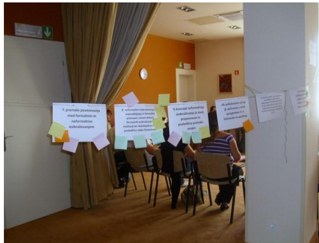
Delo je potekalo na mladim prijazen in kreativen način.