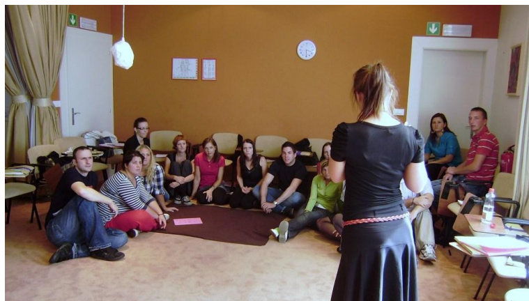
Naslednji dan smo nadaljevali smo o zaposlovanju.