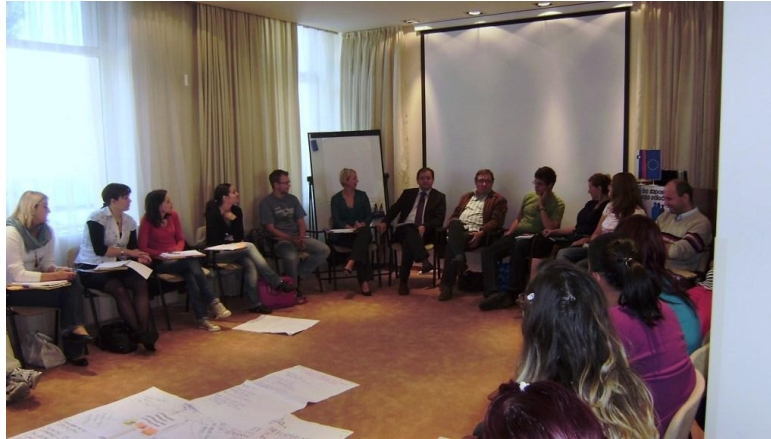
S strokovnjaki o izobraževanju.